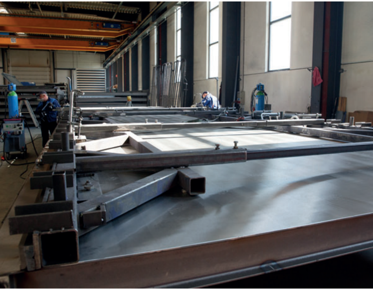
As paletes de formas da Weckenmann com a sua superfície de moldagem homogênea podem ter até 15 metros de comprimento e 10 toneladas.