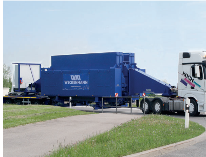
A caminho dos clientes: Forma em bateria MBM® para produção vertical de paredes e pisos maciços.

para a aplicação no local. A forma em bateria com as formas central e exterior pesadas e os outros componentes centrais são firmemente montados em um veículo especial. Toda a instalação e desinstalação pode ser executada em poucos dias por cinco a sete pessoas.