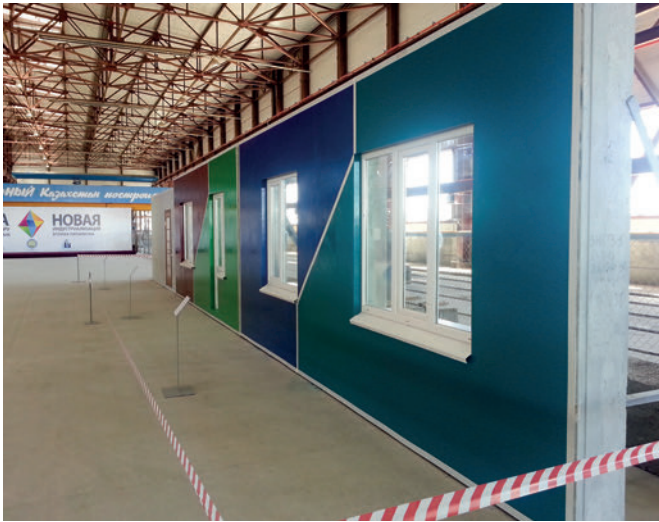
Готовы к сборке на стройплощадке: стеновые панели с оконными проемами

ске), пятом по величине городе Казахстана, состоялось торжественное открытие второй линии Weckenmann на ДСК с участием губернатора Бердыбека Сапарбаева. Начиная с середины 2016 года, производитель ЖБИ «Уй Курылыс» выпускает на линии перекрытия, сэндвич-панели, внутренние перегородки, элементы лифтовых шахт и лестничные марши.