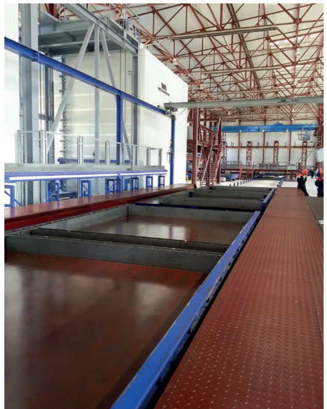
Новая крупногабаритная и высокопроизводительная линия оборотных поддонов Weckenmann в Казахстане

В начале 2016 года швабское машиностроительное предприятие Weckenmann успешно ввело в эксплуатацию один из крупнейших ДСК в Казахстане для ТОО «GLB» в Астане. 30 августа 2016 года в Актобе (бывшем Актюбин-