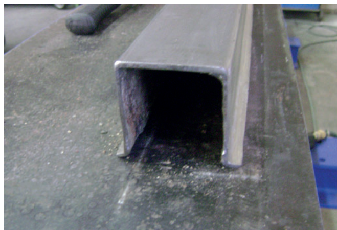
Depois: Formas como novas: formas endireitadas e otimizadas ao nível da sua função