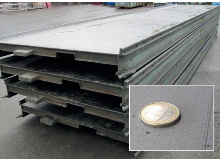
Superfície de moldagem da paleta com má qualidade antes da renovação: estrias profundas e superfície de moldagem desnivelada; pintura defeituosa

Logo em 2007 foi construído, especificamente para a produção de paletes, formas e sistemas de moldagem, um galpão de produção novo com 3000 m 2 e equipamento ultramoderno para a construção de formas. Aí são produzidos os mais variados formatos de formas e sistemas de moldagem de qualidade muito elevada por uma equipe coesa e experiente. Sejam paletes ou sistemas de moldagem com tecnologia magnética para instalações de circulação, formas estacionárias como mesas basculantes, formas em bateria ou formas para elementos de concreto com a forma de barra – existe um produto adequado para todos os requisitos do cliente.