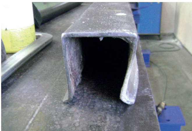
Antes da renovação dos sistemas de moldagem: formas deformadas e danificadas