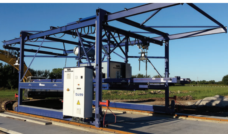
Vista general de la máquina

Weckenmann Anlagentechnik GmbH+Co.KG Birkenstraße 1, 72358 Dormettingen, Alemania T +49 7427 94930, F +49 7427 949329 info@weckenmann.de , www.weckenmann.com