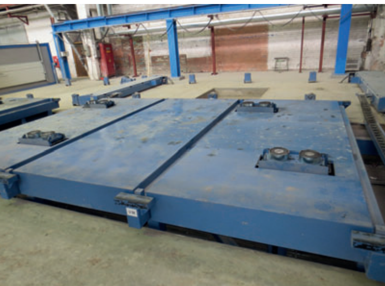
Kombinierte Rüttel-Schüttelstation mit Hochleistungselektromagneten

Eine weitere Neuerung in Form eines innovativen Verdichtungssystems wurde bei DSK Blok zum ersten Mal erfolgreich realisiert. Neben einer konventionellen Schüttelstation, die die Palette niederfrequent längs, quer und zirkular oszillieren lässt, wurde eine Hochfrequenzrüttelstation eingebaut. Damit die Übertragung der Vibrationsenergie ohne Umweg direkt in die Palette erfolgt, werden die Rüttler mittels Hochleistungselektromagneten mit der Palette verbunden. Durch diese nahezu verlustfreie Einleitung der Schwingungen wird das Lärmniveau um über 10 dB, also um