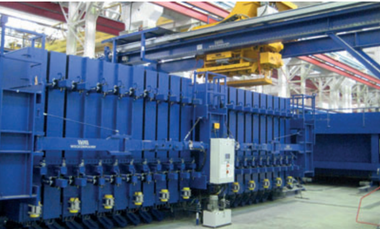
Batterieschalungen eignen sich ideal zur platzsparenden Herstellung beidseitig schalungsglatte Wandelemente.