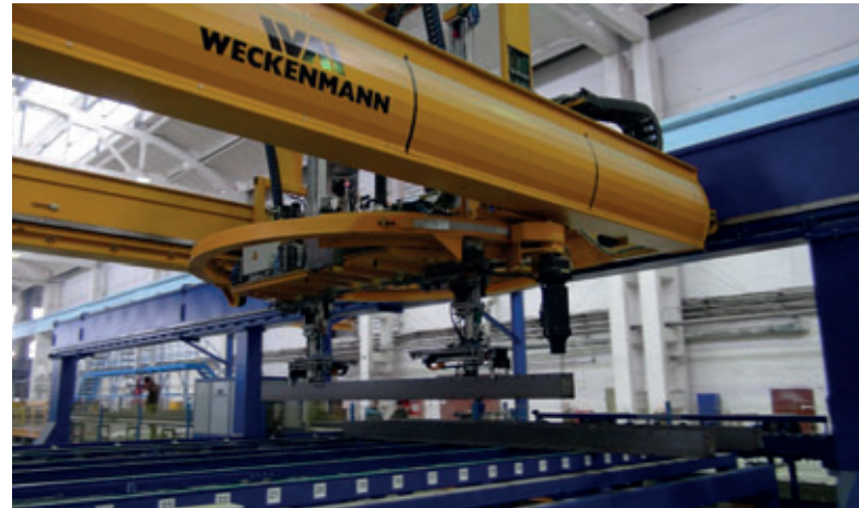
Der Twin-Z-Schalungsroboter überzeugt durch seine Schnelligkeit und Präzision.