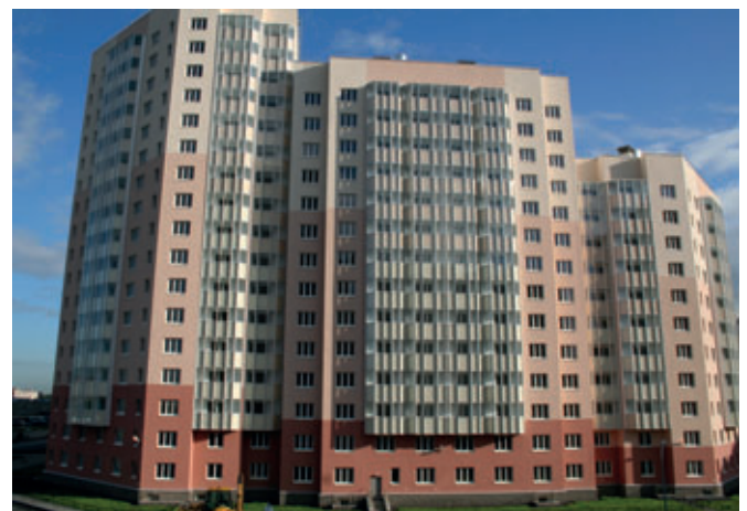
Wohnanlagen können durch den Einsatz modernster Technologie aus Deutschland nun in besserer Qualität und kürzerer Lieferzeit fertiggestellt werden.