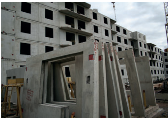
Das neue Hausbausystem von Blok ersetzt die traditionelle Sandwichbauweise durch ein System aus tragenden Wänden und Wärmedämmverbundsystem.