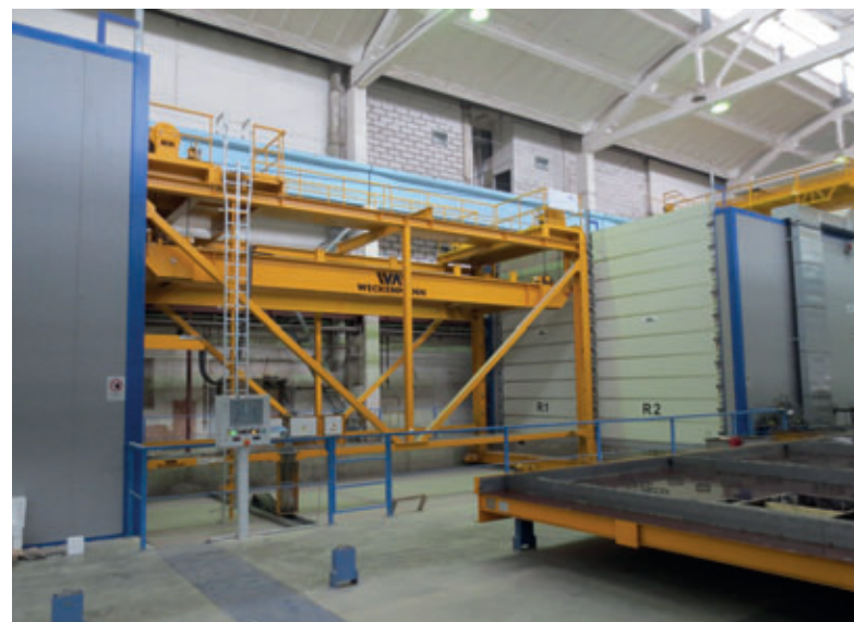
Härtekammer mit Warmluftheizung