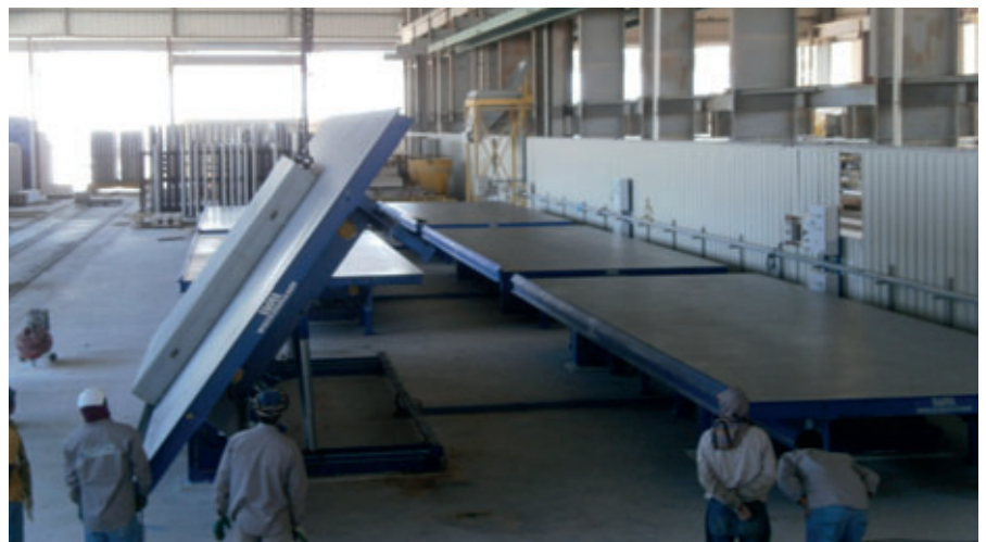
Las modernas mesas basculantes de Weckenmann convencer por su calidad «made in Germany»