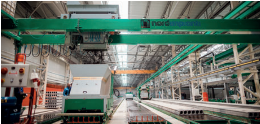
Installation de fabrication de dalles alvéolées de la société Nordimpianti

réutilisée aussi bien dans l'installation de mélange que pour nettoyer les camions malaxeurs.