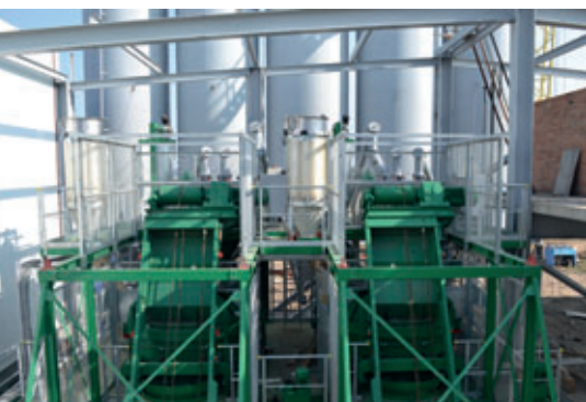
La société Teka a fourni l'installation de mélange nécessaire à la nouvelle usine

Jusqu'à 420 000 m 3 de béton par an peuvent être transformés dans la nouvelle usine. Une usine aussi moderne ne serait pas complète sans une installation de recyclage du béton frais. Toutes les boues de béton provenant des mélangeurs, des bennes de transport sur les convoyeurs à bennes ainsi que du nettoyage des camions malaxeurs sont transportés, par le biais d'un bassin de réception, vers une installation de recyclage. L'eau et le béton sont libérés des agrégats dans un bassin récepteur. Les dépôts tels que le sable et les roches concassées sont séparés au moyen d'une vis sans fin et stockés sous la forme d'un crassier. L'eau de recyclage peut être