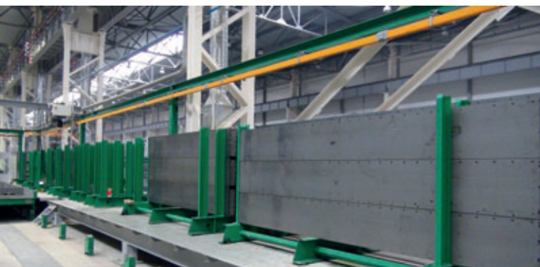
Magasin de stockage des profils de coffrage Weckenmann de la série M