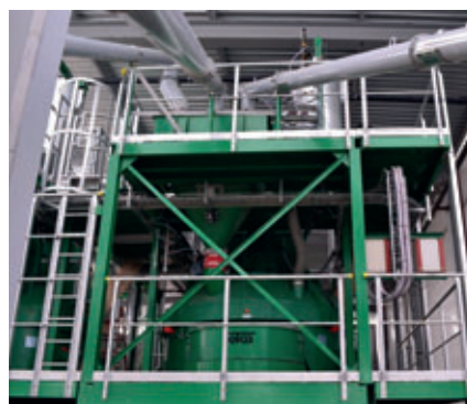
Mélangeur planétaire TPZ 3000