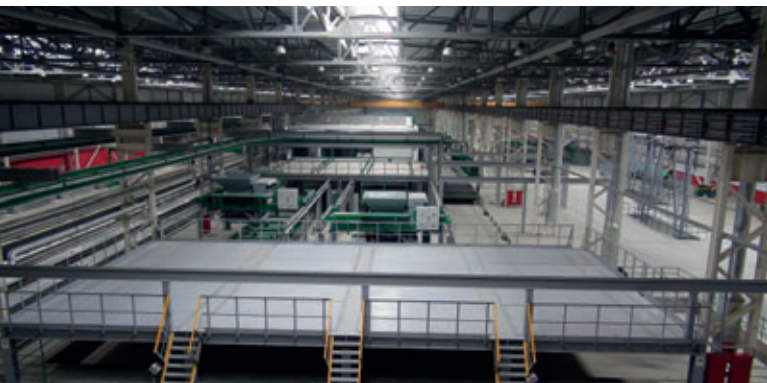
Circuit de palettes avec préparation pour la production de murs sandwichs

Durant ces dernières années, la société Weckenmann avait déjà réalisé en Russie plusieurs projets de même importance et de même complexité en tant qu'entrepreneur général. Ainsi, c'est sous la houlette de la société Weckenmann qu'une équipe bien rodée - Weckenmann (direction générale,