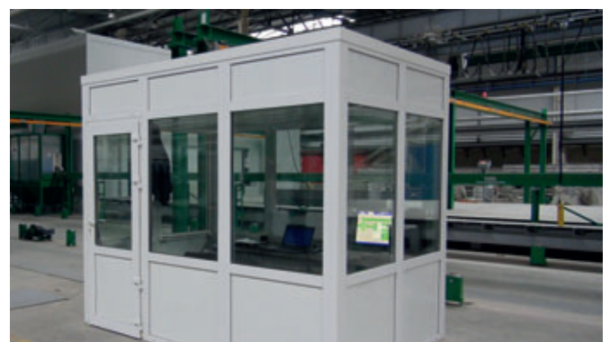
Centre de contrôle du calculateur pilote WAvision