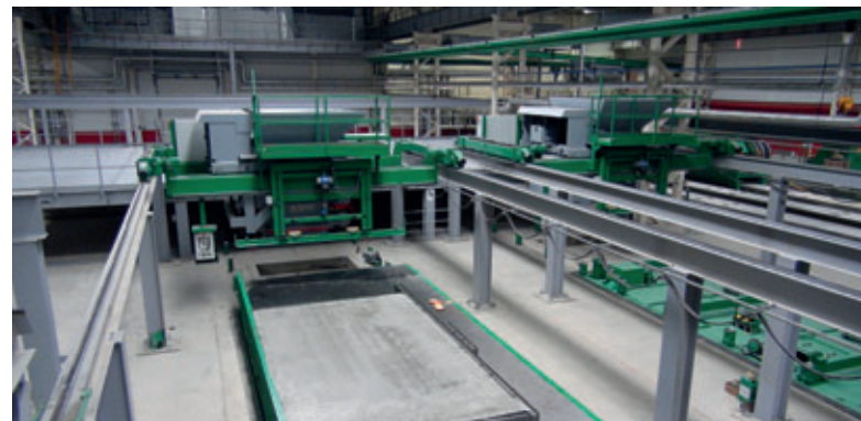
Distributeur de béton avec station de compactage