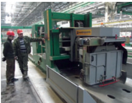
Scie pour béton de la société Nordimpianti

La société Nordimpianti a fourni l'installation de fabrication de dalles alvéolées pour des éléments d'une hauteur de 220 mm et d'une largeur de 1 200 mm. Cette installation de production totalement automatisée